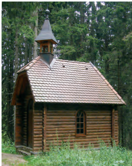
Nová boubínská kaple.

Šumavská hora Boubín (1362,2 m n. m.) se vypíná východně od Kubovy Huti. Adolf Schwarzenberg si vybudoval lovecký zámek na jižním úbočí hory, na okraji nově zřízené jelení obory, ve výšce 1150 m n. m. Byl situován severovýchodně od proslulého Boubínského pralesa, přibližně v polovině vzdálenosti mezi vrcholem a Boubínským jezírkem, které bylo zřízeno v roce 1833 či 1836 jako umělá vodní nádrž na Kaplickém potoce pro plavení dřeva ze zdejších lesů do sklárny v Lenoře. U zámku byla postavena chata pro služebnictvo a stáje a na louce pod ním lovecká střelnice. V západním sousedství zámku vyrostla v roce 1905 dřevěná kaple, v níž se před zahájením každého lovu konaly bohoslužby. V roce 1931 byl Boubín zestátněn a Jan Schwarzenberg dal zámek i kapli ve shodě s uzavřenou dohodou rozestat a přemístit do Staré obory u Hluboké nad Vltavou, kde stojí dodnes. Na Boubíně zůstaly pouze podezdívky a vedlejší budovy. Stáje byly strženy v 60. letech 20. století, pouze chata pro služebnictvo, využívaná jako lovecká chata, přežila celé období socialismu, ale ve změněné podobě, kterou jí dala přestavba v roce 1961. Lesy České republiky v roce 2000 tehdy již nevyužívanou chatu strhly a na jejím místě vybudovaly novostavbu pro individuální či rodinnou rekreaci. V následujícím roce došlo i na výstavbu repliky zaniklé kaple, a to podle dochovaných fotografií. Kaple byla slavnostně vysvěcena 3. 10. 2001. Opravena byla i podezdívka zaniklého loveckého zámku, která slouží jako vyhlídková terasa.