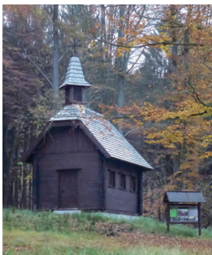
Boubínská kaple ve Staré obore u Hluboké nad Vltavou.